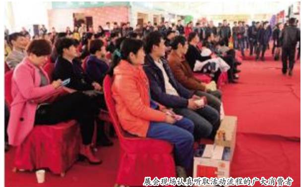
展会现场认真听取活动流程的广大消费者

有决心,能够高标准、按时、保质的完成所有施工任务。公司将精心组织、精致施工,严格控制施工质量,加快施工进度,做到文明施工,争创文明工地。同时,我们将接受甲方及监理单位的监督,确保按期完工。华成地基公司愿竭尽全力为华成品牌而努力奋斗!