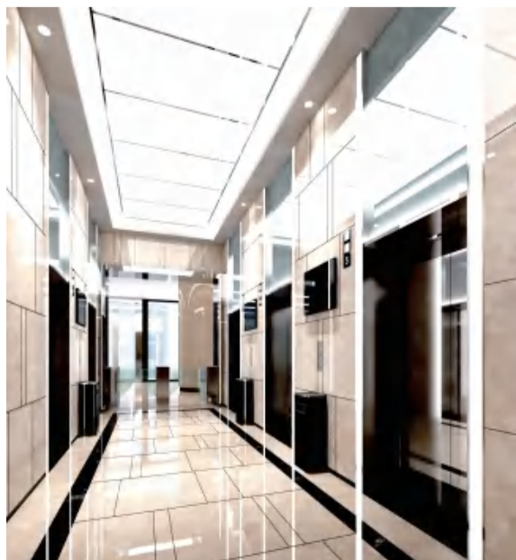
效果图 实际解释权归华成集团所有