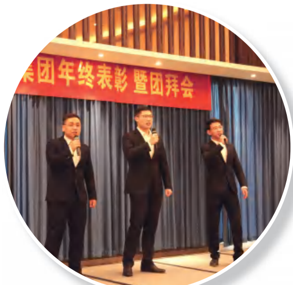
总裁办大合唱《大中国》