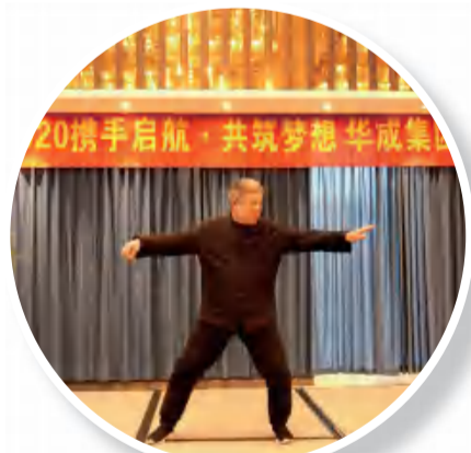
太极表演(建设公司)