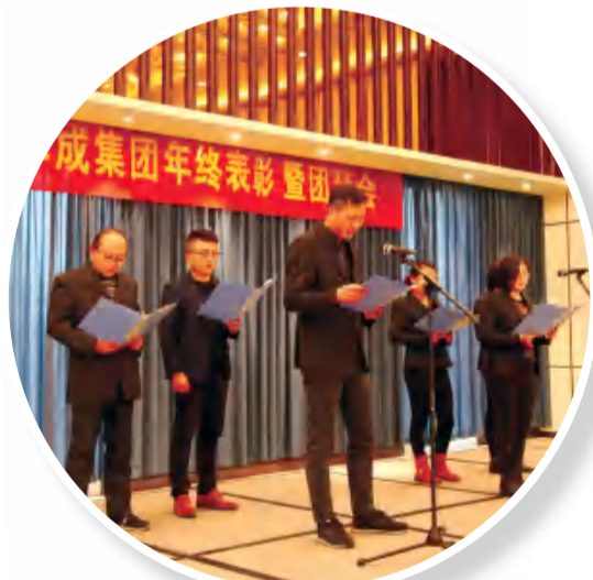
诗朗诵《中华颂》(地基公司)