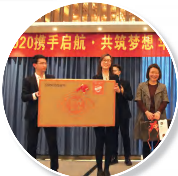
幸运大抽奖和游戏环节大奖好礼精彩纷呈