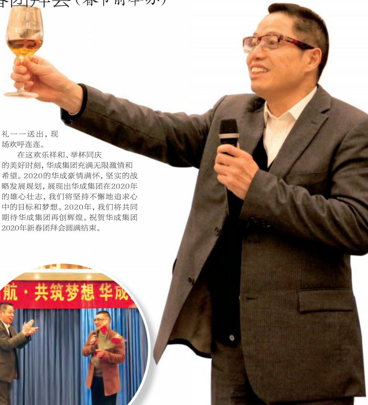
礼一一送出,现场欢呼连连。

节日期间还穿插了令人期待的幸运大抽奖环节和精彩的游戏环节,集团领导分别抽取了新年好运奖、新年健康奖、新年福气奖、新年美丽奖、新年鸿运奖等奖项共抽出41个幸运儿,并与获奖者合影留念。年会为大家准备了丰厚的礼品,有限量纪念币礼盒,限量精美铂金项链礼盒,智能电饭煲,超大智能电视等,此外还有电炖锅、吸尘器、搅拌器等惊喜好