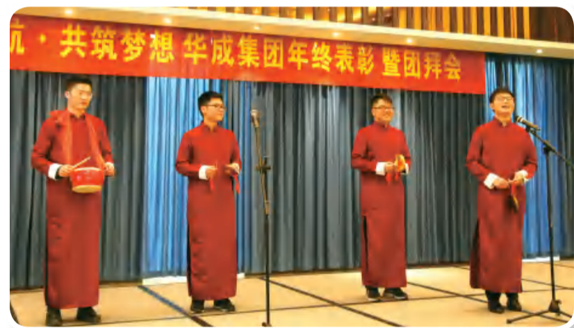
集团小伙表演三句半