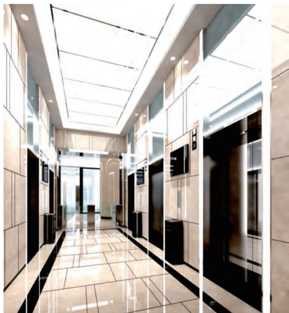
效果图 实际解释权归华成集团所有