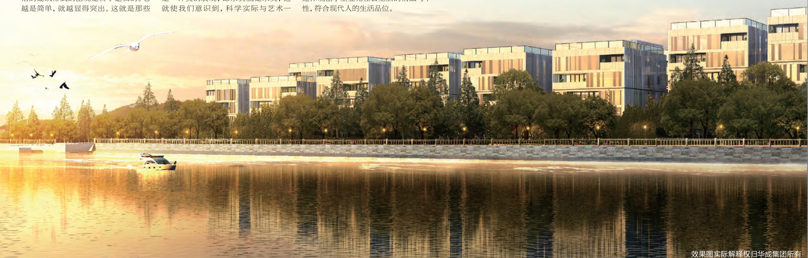
效果图实际解释权归华成集团所有