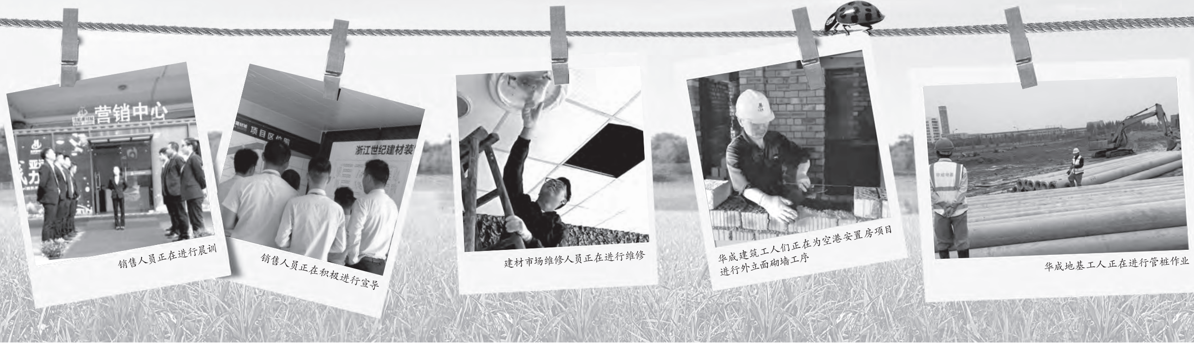
销售人员正在进行晨训