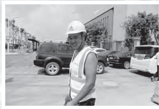
春日里地基劳动者的笑颜

梦想的花朵， 只有以劳动浇灌才能绚丽地绽放； 劳动者们以任何形式付出的辛苦， 都值得肯定和尊重； 向劳动者致敬， 您辛苦了，节日快乐！