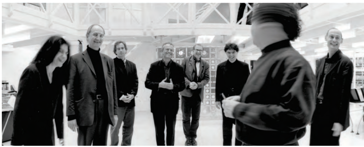
白塔项目设计团队——法国AS建筑设计工作室