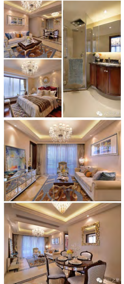
品尝完精致美食,参与过缤纷活动,大家都会选择到实景样板房里去瞧瞧转转。9.8米面宽,阔绰飘窗和露台,套房式主卧……样板房处处有惊喜,让人分分钟想拥有!热情招待了自己的味蕾,满足了动手DIY的愿望,又能把家电好礼捧回家,更重要的是,还可以在此畅享一下未来生活,这么尽兴的周末聚会,当然只有大江之星才能给你!