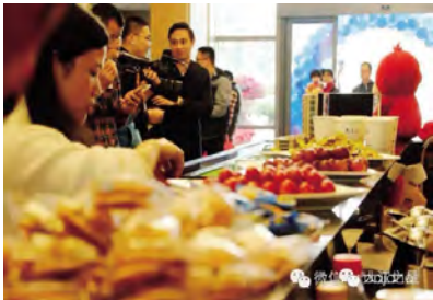
春天刚到,五颜六色的风筝,就纷纷“驻扎”在了我们的售楼处。大家细心地在风筝上绘制着喜欢的图案,借此机会放飞心中的“春天”!