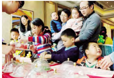
披萨DIY是最受孩子们青睐的环节,厚实的饼底和丰富的馅料相融合,经过高温烘焙,变成可口的披萨,你一块我一块,在动手的过程中,也感受着分享的快乐。