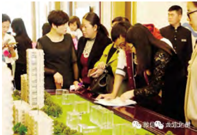
猴嗨森3月初的这个周末,大江之星简直“嗨翻天”啦!“周末嘉年华”活动现场,摩肩接踵,热闹非凡,全天气火爆!