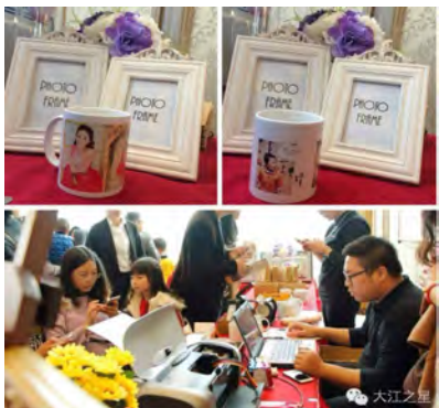
把自己和亲友的照片,印在马克杯上永久保存,是不是一个留住时光的好方法?参与者们捧着制作好的马克杯,真是爱不释手!