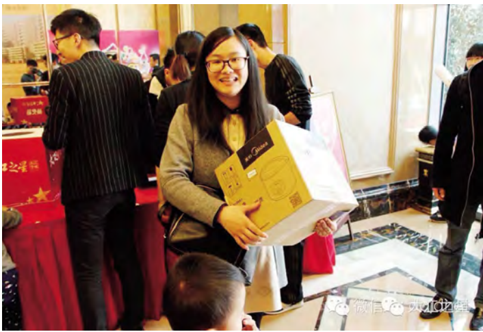
谁会是谁得众多好礼的幸运儿?紧张的音乐不禁令人屏息期待,我们的抽奖结果是……无疑是整点抽奖环节,能让现场迅速沸腾起来的!