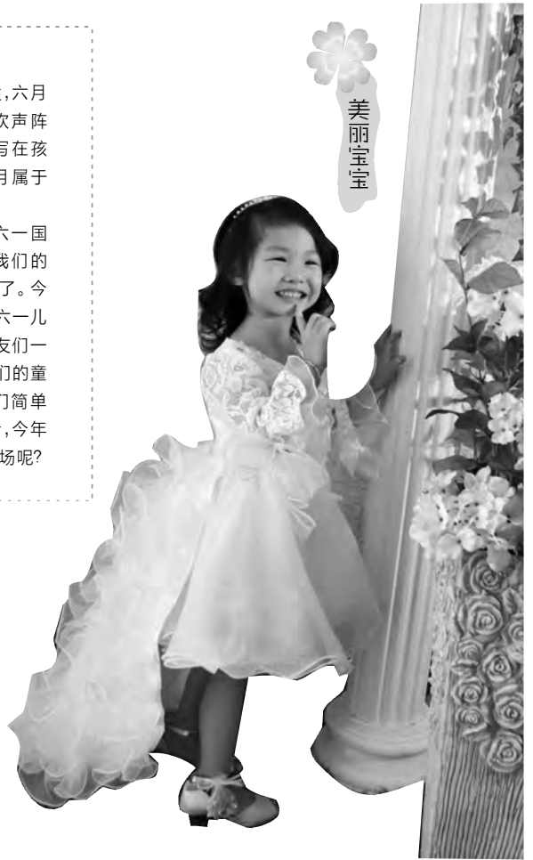
祝宝贝健康快乐的成长,六一儿童节快乐! 金诚小贷 蒋汇