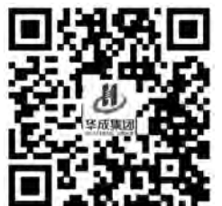
更多精彩内容请关注华成官网