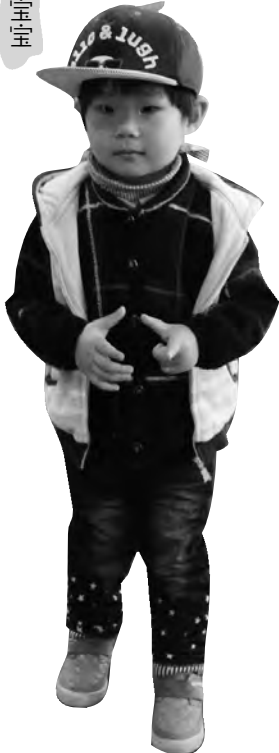
“嘿嘿嘿嘿,祝弟弟健康成长!嘿嘿嘿嘿,原弟弟快乐每天!嘿嘿嘿嘿,这是妈妈最大的心愿!” 金诚小贷 于洪潮