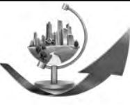
华成转型升级新关注