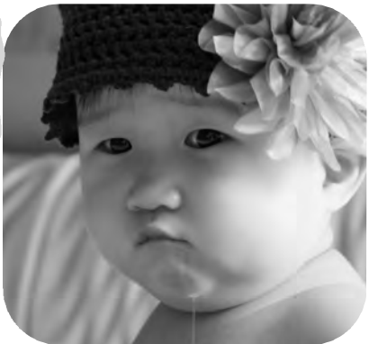
妈咪对考拉小朋友的期许特别简单:能玩、爱玩、会玩!足矣! 金诚小贷 楼雯艳